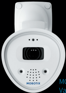
MOBOTIX ONE Vario