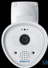
MOBOTIX ONE Fix