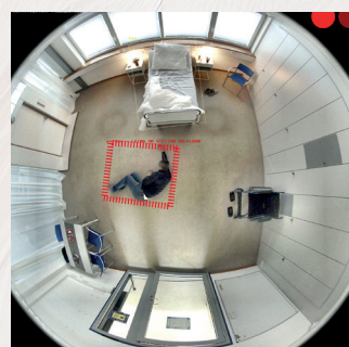
Vue panoramique à 360° sans angle mort

Ce capteur intelligent et innovant dispose d'une large gamme de fonctions qui ont été développées pour fournir un soutien optimal aux soins :