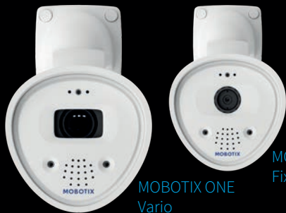
MOBOTIX ONE Vario