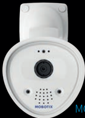
MOBOTIX ONE Fix