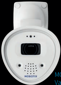
MOBOTIX ONE Vario